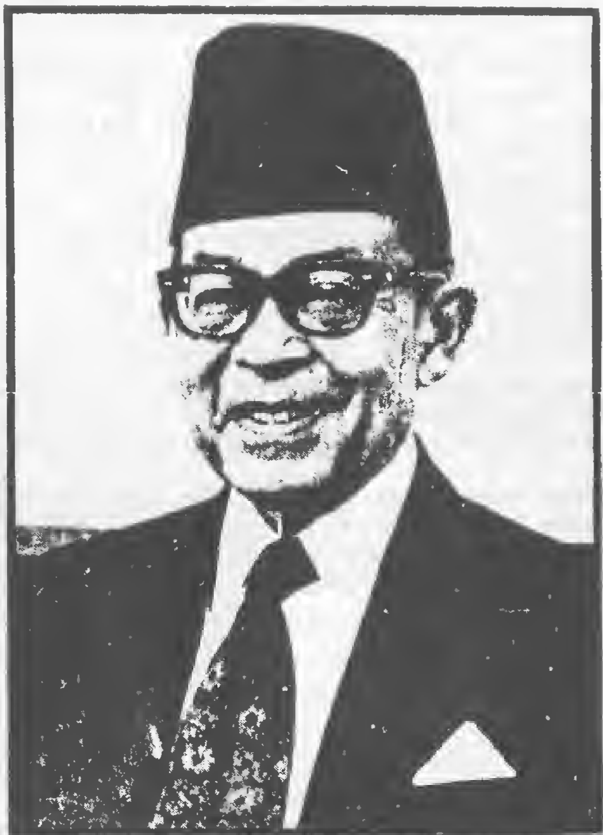
DOKTOR H. MOHAMMAD HATTA PROKLAMATOR KEMERDEKAAN INDONESIA, WAKIL PRESIDEN REPUBLIK INDONESIA I WA- FAT HARI JUM'AT 27 RABI'UL-AKHIR 1400 H. BERTEPATAN 14 MARET 1980 M.

Ya Allah, ya Tuhanku! Kalau amalku ini memperoleh pahala dari sisiMU maka sampaikanlah pahala itu kepada arwah Almarhum Dr. H. Mohamad Hatta, proklamator kemerdekaan Indonesia dan pemimpin besar kami yang jujur dan ikhlas! Amin, ya Rabbal-'alamin!